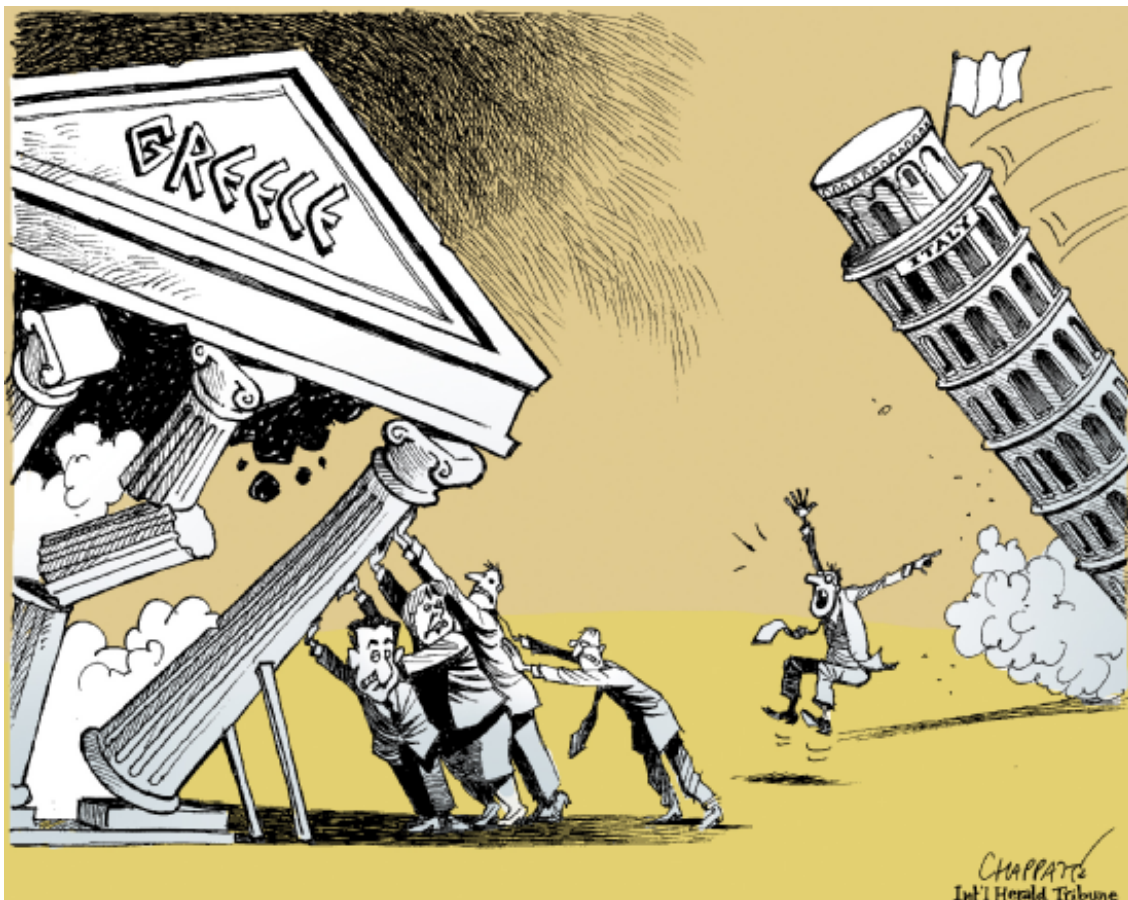
© Chappatte, 12 novembre 2011, dans International Herald Tribune - http://www.globecartoon.com/

Cours réalisé en octobre 2011 – janvier 2012