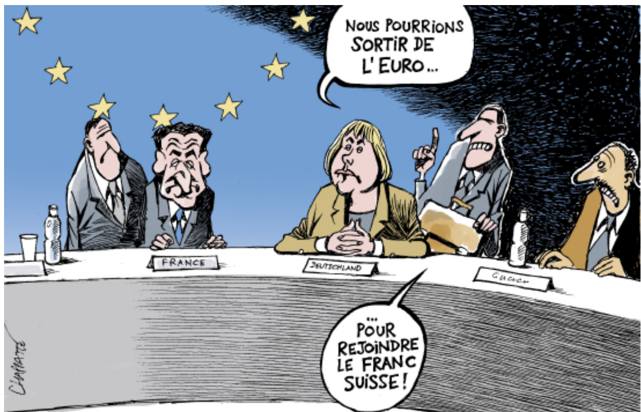
© Chappatte, 16 décembre 2010, dans Le Temps (Genève) - http://www.globecartoon.com/